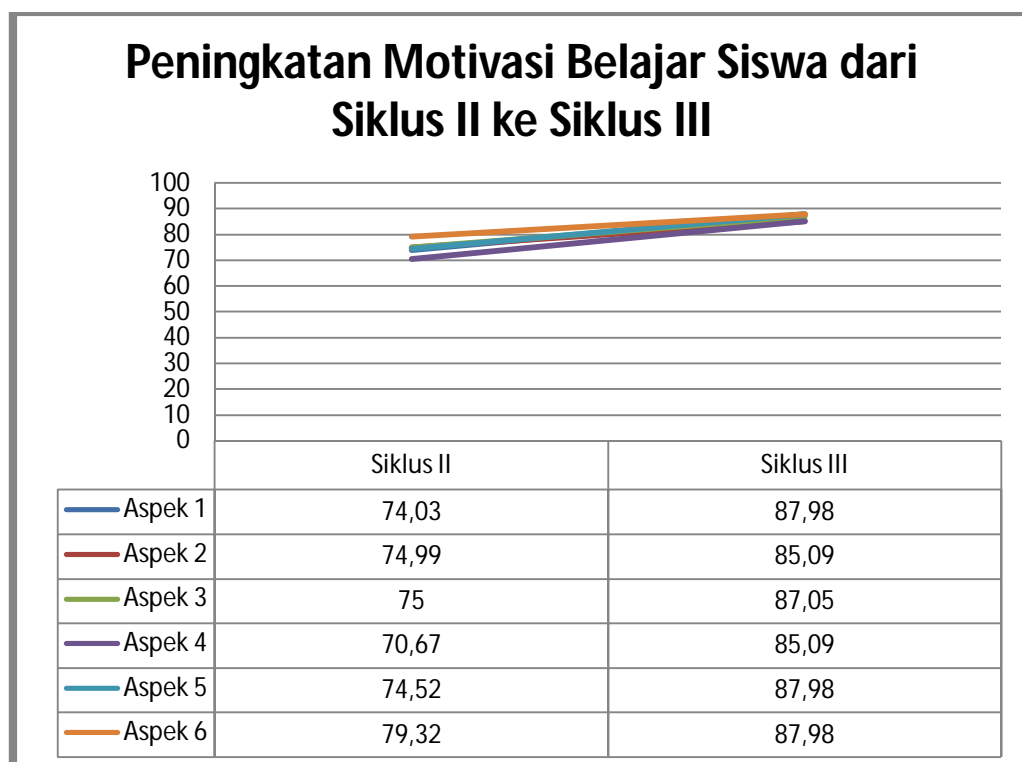
Grafik 2 : Peningkatan Motivasi Belajar Siswa dari Siklus II ke Siklus III

Nilai hasil tes pada pembelajaran di siklus III, terlihat bahwa nilai rata-rata kelas yang diperoleh dari hasil tes formatif siklus ke III adalah 2,97. Nilai rata-rata ini lebih baik dari nilai rata-rata pada hasil siklus II. Kemudian terlihat pula bahwa nilai tertinggi yang berhasil diraih oleh siswa adalah 3,84, sedangkan pada siklus II adalah 3,50. Selanjutnya nilai terendah juga meningkat dari 1,85 menjadi 2,18.