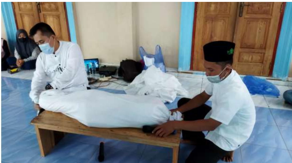
Gambar 4. Suasana Pelatihan saat Praktek Peserta