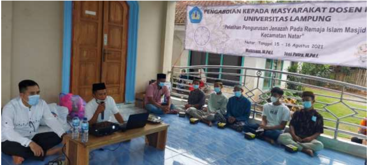
Gambar 6. Suasana Pengabdian Masyarakat Berlangsung