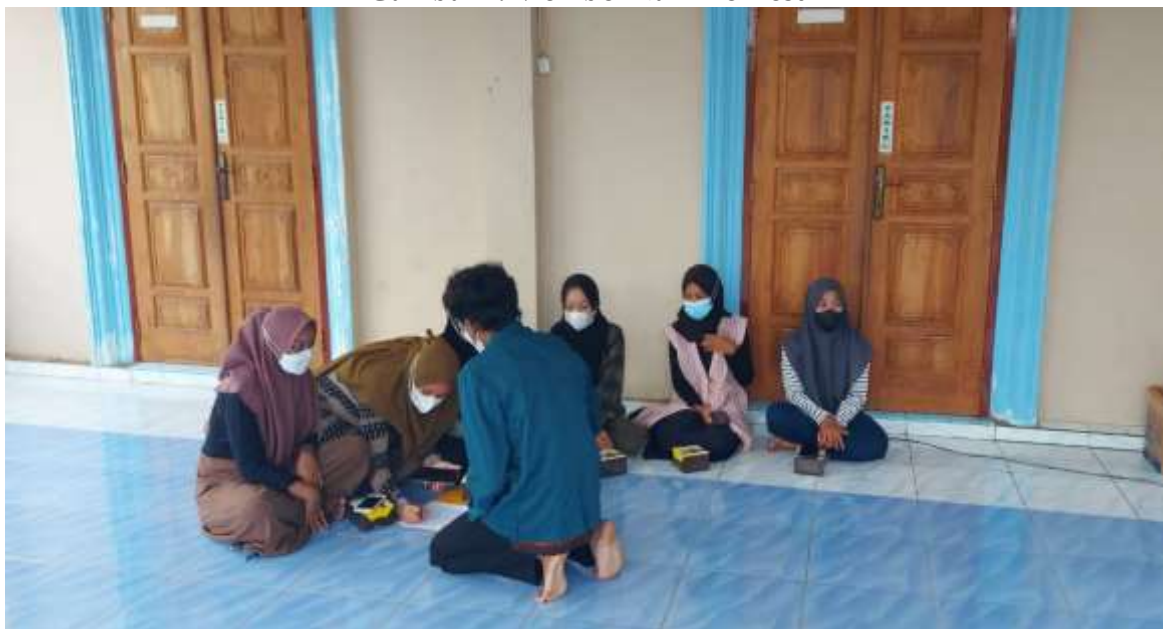
Gambar 1. Memberikan Pre-Test

Kegiatan pelatihan dimulai dengan pemateri memberikan materi terkait pengurusan jenazah. Materi pelatihan dalam bentuk power point juga dilengkapi dengan gambar yang interaktif da juga video, sehingga memudahkan peserta dalam memahami materi yang diberikan. Tanya jawab juga dipersilahkan manakala ada