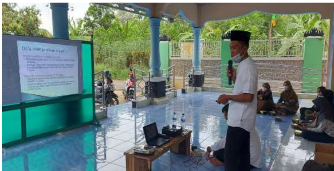
Gambar 2. Memberikan Materi

Kegiatan selanjutnya pemateri mempraktekkan pengurusan jenazah dengan media boneka dan kain kafan, serta hal lain yang dibutuhkan. Kemudian peserta mempraktekkan pengurusan jenazah per group karena pengurusan jenazah ini tidak dapat dilakukan sendiri. Adapun rincian yang dilakukan peserta sebagai berikut: