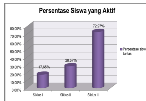
Grafik 1. Persentase Siswa Aktif