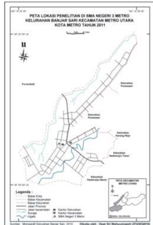
Gambar: Peta Lokasi Penelitian Di SMA Negeri 3 Metro

Selain itu, pembelajaran ini juga menerapkan pembelajaran dengan tutor sebaya yaitu peserta didik dapat belajar dengan peserta didik lain, sehingga peserta didik yang memiliki kemampuan rendah dapat belajar dengan peserta didik yang memiliki kemampuan tinggi. Dengan berbagai aktivitas belajar yang dilakukan oleh peserta didik tersebut maka mempengaruhi prestasi belajar yang diperolehnya. Aktivitas belajar geografi siswa yang tinggi akan menyebabkan prestasi belajar geografi siswa pun akan meningkat karena aktivitas sangat menentukan intensitas belajar peserta didik.