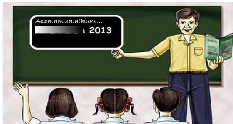
Gambar 1. Tampilan Pembuka Modul Interaktif

Gelombang” dan teks e-mail peneliti “diansahriramadhan@gmail.com” untuk memberikan kesempatan kepada pengguna menyampaikan kritik, saran, dan pertanyaan seputar modul interaktif yang telah dibuat. Gambar tampilan pembuka dapat dilihat pada Gambar 1. Sedangkan tampilan beranda dapat dilihat pada Gambar 2.