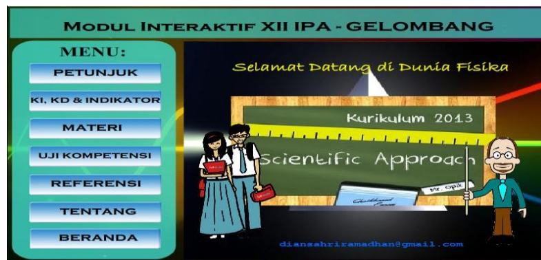
Gambar 2. Tampilan Beranda Modul Interaktif

(3) Pilihan menu: untuk memudahkan pengguna dalam mengakses menu-menu yang terdapat pada modul interaktif, fitur menu ditempatkan di bagian kiri tampilan dan diatur sedemikian rupa agar fitur menu