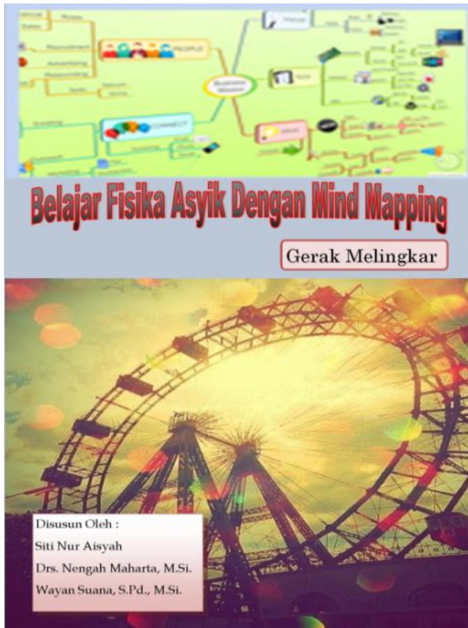
Gambar 2. Desain Cover