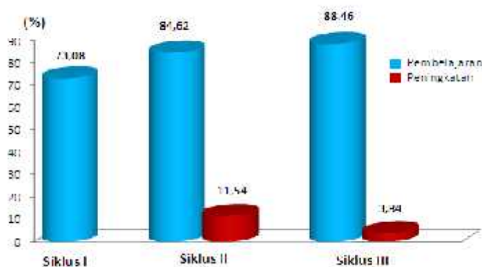
Grafik 1. Persentase Ketuntasan Hasil Belajar Kognitif per-Siklus

Peningkatan persentase ketuntasan hasil belajar kognitif per-siklus dapat dilihat pada grafik di bawah ini: