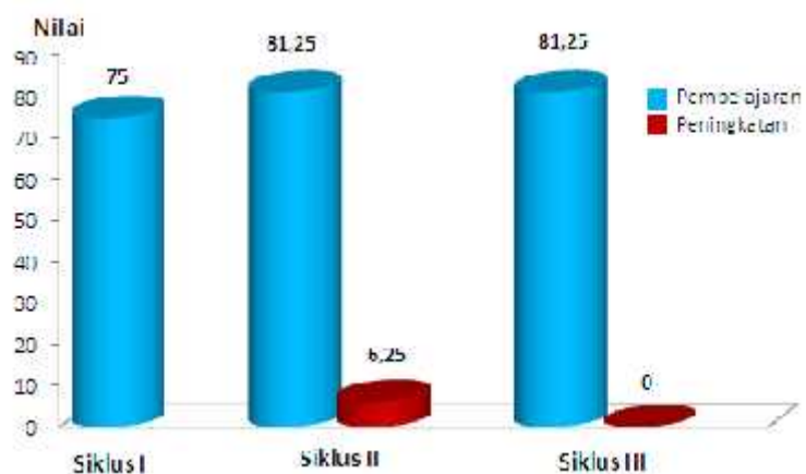
Grafik 4. Nilai Kinerja Guru per-Siklus

Peningkatan kinerja guru per-siklus dapat dilihat pada grafik di bawah ini: