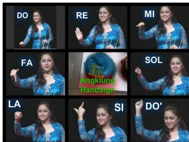
Gambar 2 Teknik hand sign digunakan oleh Saung Angklung Udjo

Teknik hand sign merupakan teknik pengajaran musik dengan merubah fungsi notasi menjadi gerak tangan. Penamaan nada mulai dari do sampai dengan si digunakan dengan bentuk-bentuk yang mudah dipahami. Teknik ini dapat dilakukan dalam pembelajaran ansambel dengan membagi kelompok nada atau instrumen musik. Dengan kata lain, teknik dalam metode ini merupakan bahasa musik yang digunakan dalam pembelajaran ansambel dalam jumlah siswa yang cukup besar. Di Indonesia Metode hand sign digunakan di Saung Angklung Udjo, Bandung.