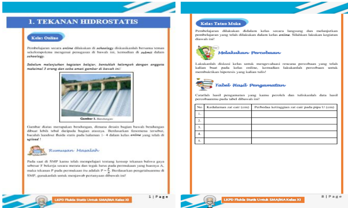
Gambar 1. Layout LKPD pada aktivitas online dan tatap muka

Rancangan LKPD model blended learning yang dikembangkan, dibuat dengan menggunakan Microsoft Office Word 2013. Berikut gambar layout LKPD pada aktivitas online dan tatap muka yang dapat dilihat pada Gambar 1. LKPD yang dikembangkan menggunakan model blended learning dengan tahapan pembelajaran online - tatap muka. Sesuai dengan pendapat dari Sari dan Asrial (2016) bahwa pada pembelajaran blended learning disusun dalam dua kegiatan utama yaitu online -tatap muka. Selain itu, pada proses pembelajaran juga menggunakan handout yang dikembangkan disertai dengan contoh soal pada setiap submaterinya. Sejalan dengan Helmanda dan Armalita (2012), handout efektif dapat meningkatkan keingintahuan siswa mengenai materi sehingga siswa terdorong untuk belajar dan terus belajar.