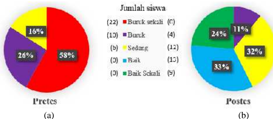
Gambar 1. Persentase model mental siswa (a) sebelum pembelajaran dan (b) setelah pembelajaran

eksternalnya, maka akan menemukan kesulitan untuk menginterpretasikan molekul dalam bentuk struktur sub-mikroskopiknya.