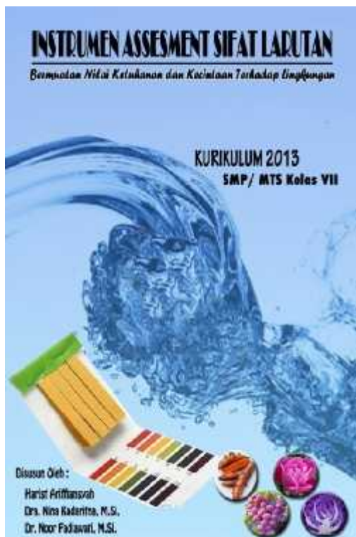
Gambar 2. Desain sampul luar bagian depan

Selanjutnya pada bagian isi menyusun kisi-kisi. Berdasarkan kisi-kisi yang telah dibuat maka dilakukan penyusunan butir soal yang terdiri dari soal pilihan jamak dan soal uraian. Soal pilihan jamak berjumlah 15 butir soal dan soal uraian berjumlah 10 soal. Jadi, jumlah soal yang dikembangkan sebanyak 25 soal. Berikut adalah rincian setiap butir soal yang mengukur indikator dimensi sikap dan dimensi pengetahuan (kognitif):