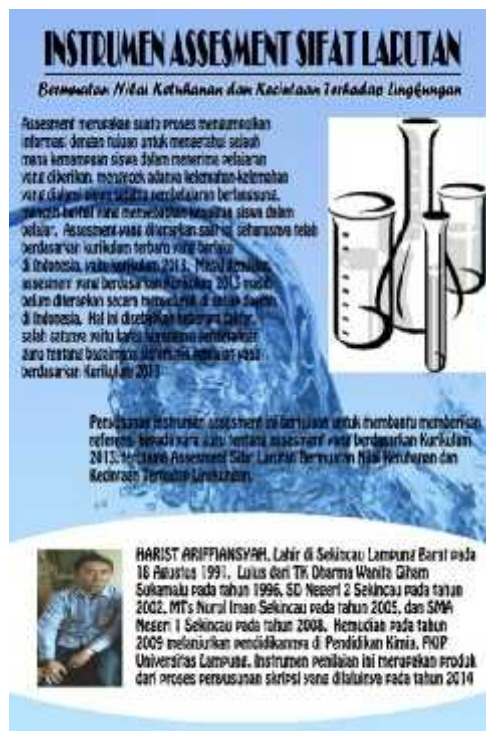
Gambar 3. Desain sampul luar bagian belakang

Setelah asesmen disusun, kemudian diuji kualitasnya melalui