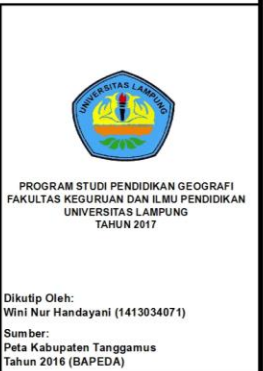
( Gambar 1: Peta Lokasi Penelitian)