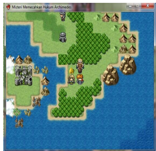
Gambar 4 Tampilan Utama

Tampilan game edukasi RPG yang dihasilkan yaitu : a) Tampilan awal yang berisi splash screen atau tampilan pembuka sebelum muncul menu untuk memulai game edukasi yang digunakan untuk menunjukkan judul game dan menunjukkan bahwa game tersebut adalah game edukasi . Pada tampilan awal juga berisi menu untuk memulai memainkan game edukasi . Tampilan awal game edukasi dapat dilihat pada Gambar 2 dan Gambar 3.