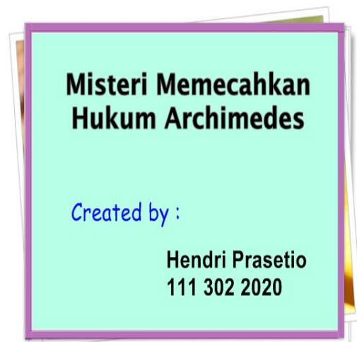
Gambar 2 Tampilan Awal Splash Screen

b) Tampilan Utama yang menampilkan karakter utama yang dimainkan, dan karakter-karakter pendukung lainnya serta denah-denah permainan. Tampilan utama game edukasi dapat dilihat pada Gambar 4.