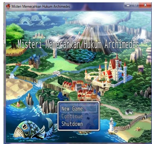
Gambar 3 Tampilan Awal Menu