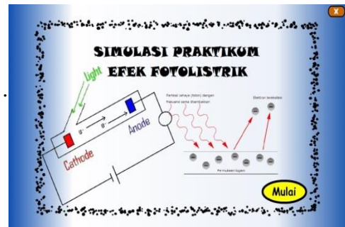
Gambar 1. Desain sampul simulasi efek fotolistrik

efek fotolistrik dapat dilihat pada Gambar 2.