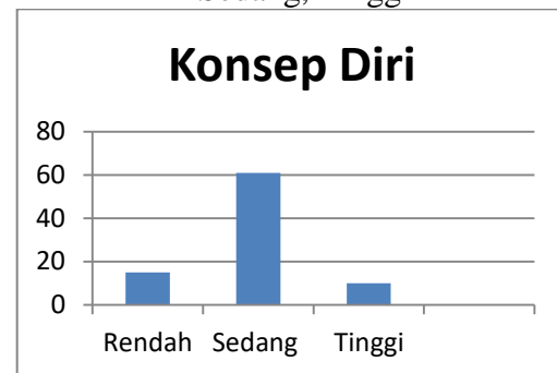
Gambar 1. Sebaran Data Konsep Diri dengan Kategori Rendah, Sedang, Tinggi

Selanjutnya untuk variabel rencana pilihan karier, sebanyak 85 siswa mengisi skala rencana pilihan karier yang terdiri dari 37 butir aitem pernyataan dengan rentang skor 1 sampai 4. Setelah data terkumpul dan ditabulasi, selanjutnya menghitung nilai mean , standar deviasi, nilai minimum dan nilai maksimum. Penghitungan dilakukan dengan bantuan program SPSS 17.00 for windows . Hasilnya dapat dilihat seperti tabel 3 di bawah ini.